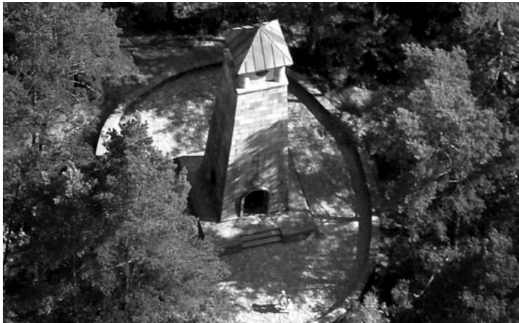
Anykščių regioninis parkas ketina sutvarkyti pajuodavusį nuo laiko ir apleistą paminklą rašytojui Jonui Biliūnui. Paminklą prieš porą savaičių jau apžiūrėjo restauratoriai.

Anykščiuose gali atsirasti du nauji turistiniai maršrutai, kurių vieno centras bus Laimės žiburys, o kito – Šeimyniškių piliakalnis.