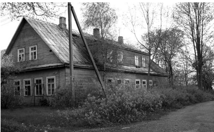
Tai – buvusi Levaniškių mokykla, uždaryta prieš šešerius metus. Dabar dauguma vaikų lanko Traupio pagrindinę mokyklą.

Beveik prieš penkiasdešimt metų Levaniškiuose buvo pasodintas parkas, užimantis apie 6 hektarų plotą. Jį sodino ir prižiūrėjo pedagogas ir gamtininkas Pau-