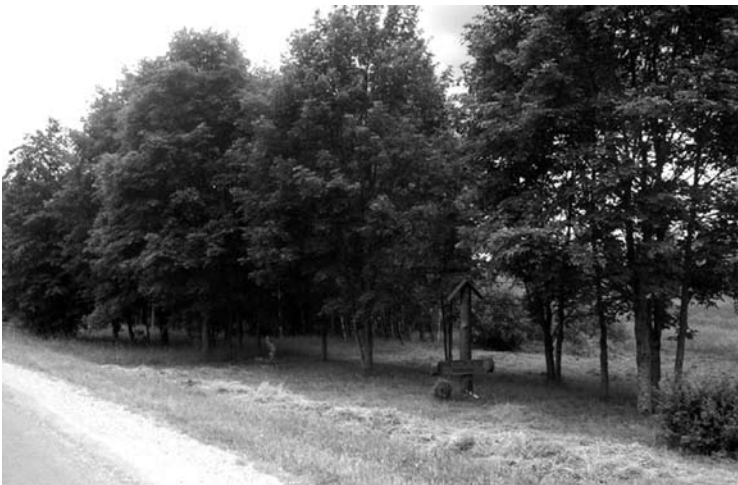
Tai - pedagogo ir gamtininko Petro Glemžos sodintas parkas, kuriame auga 65 sumedėjusių augalų rūšys.